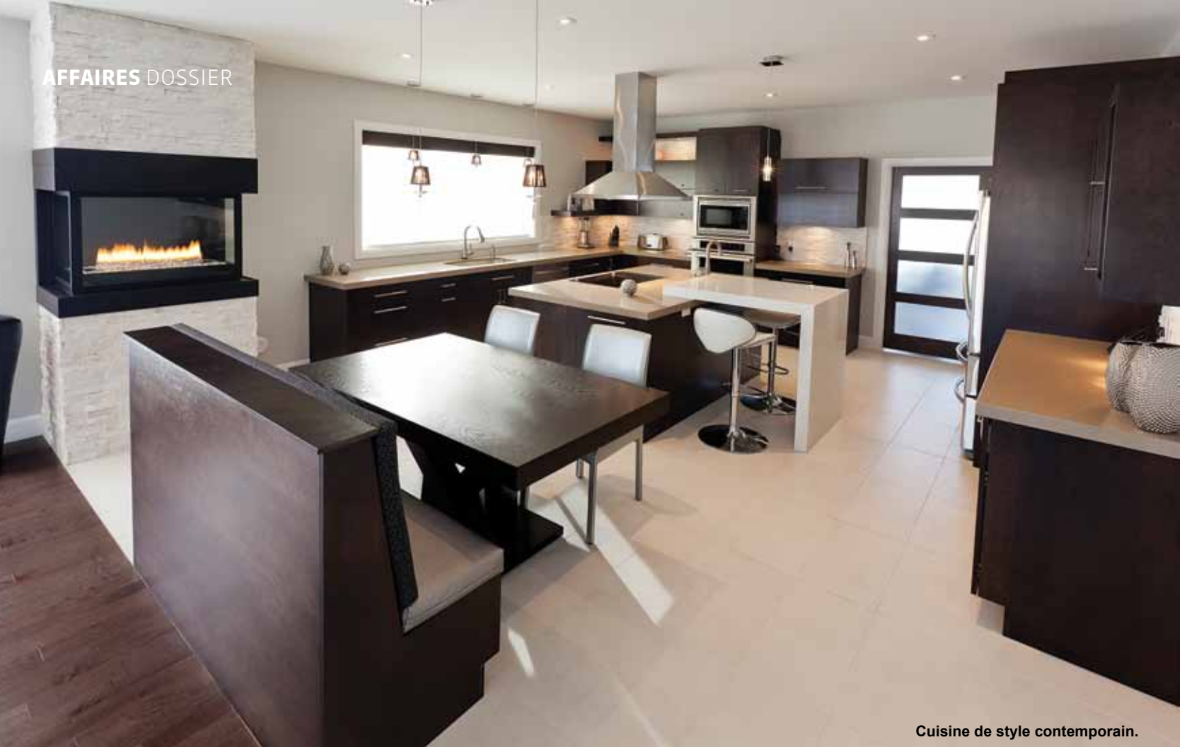
Cuisine de style contemporain.